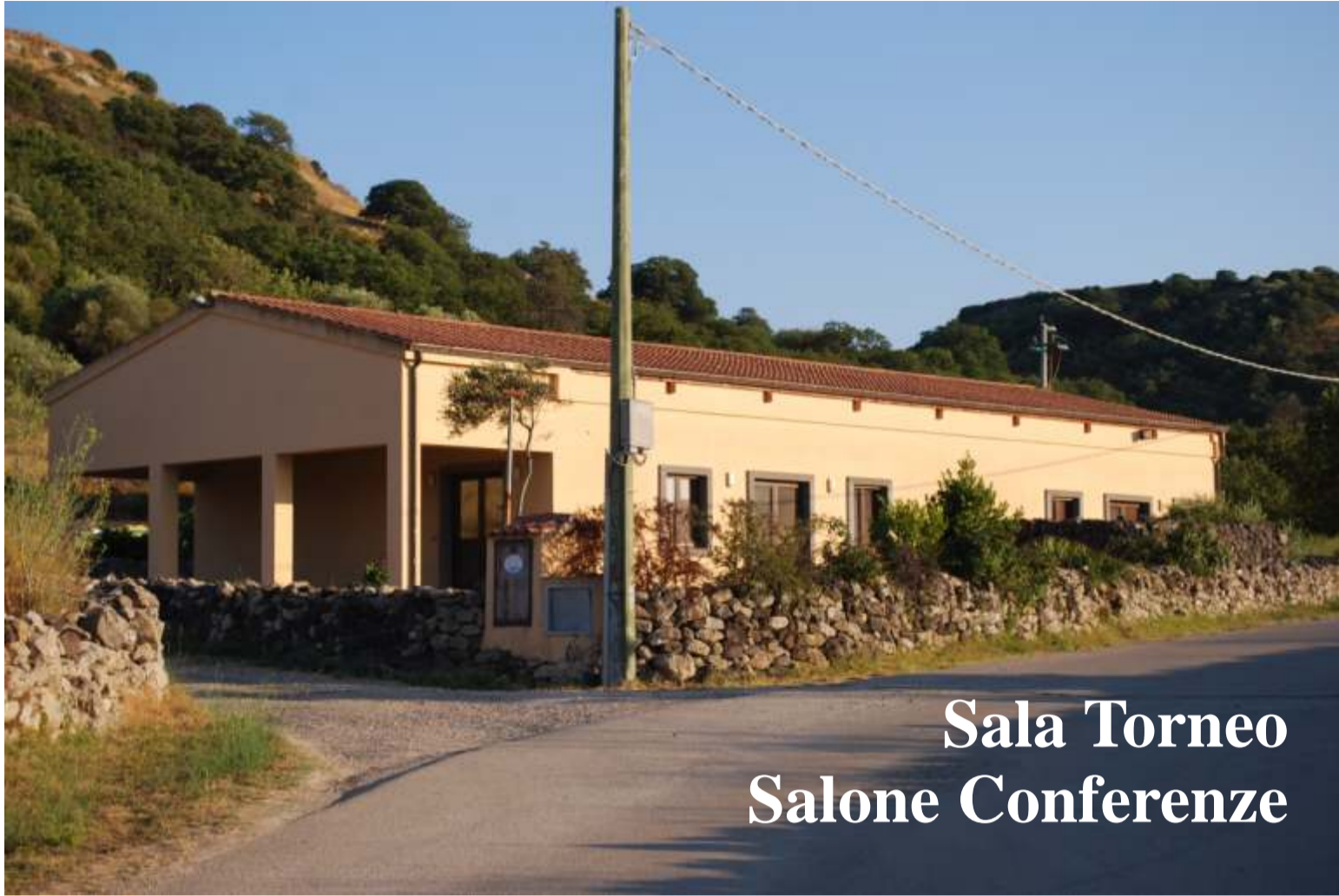
Sala Torneo Salone Conferenze